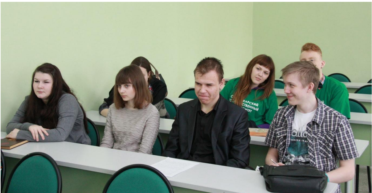
Студенты 1 курса («Политология» и «Международные отношения»)